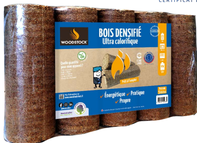
Pack de 5 bûches

Qualité contrôlée par le Laboratoire CERIC